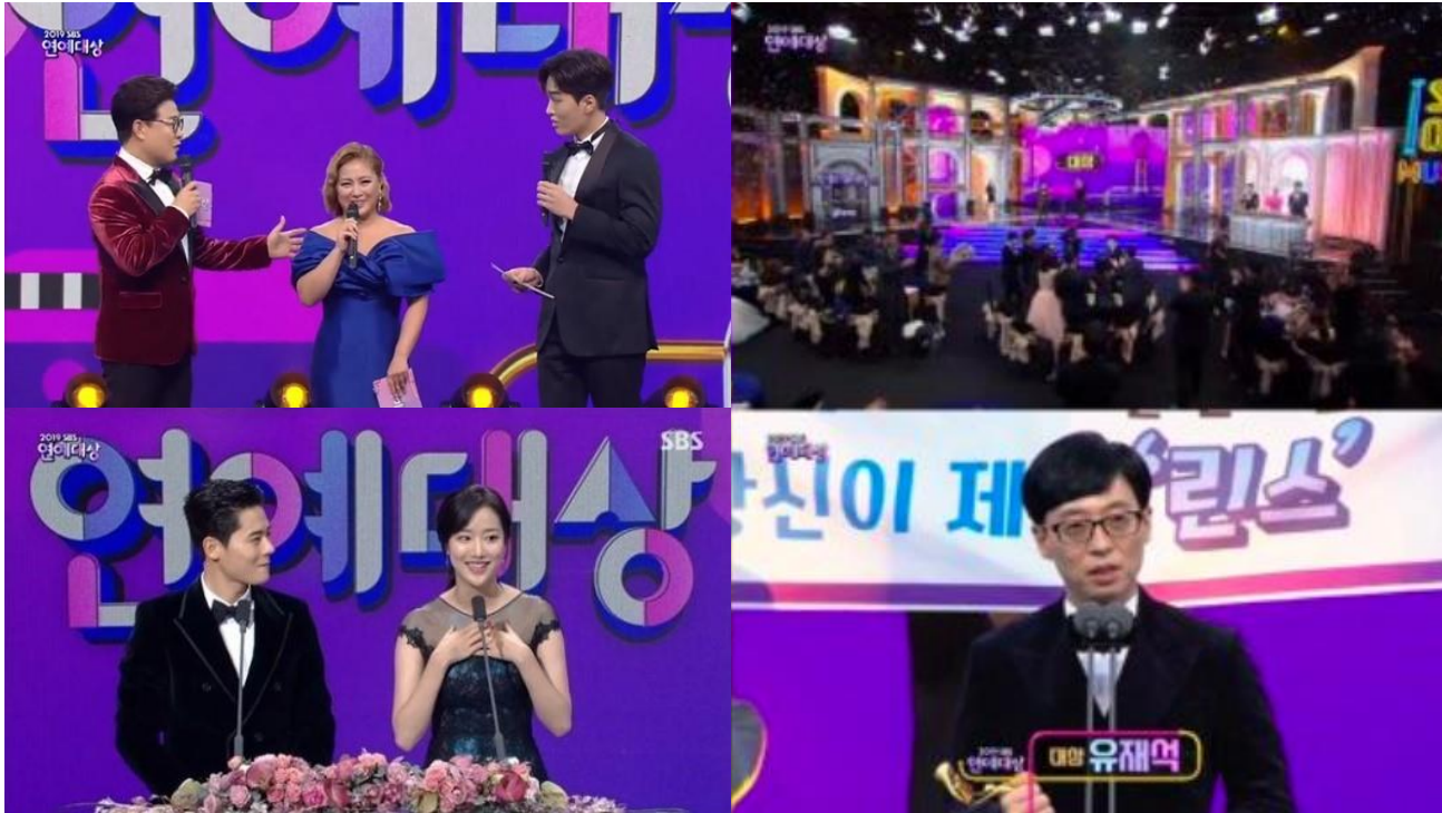
▲ <2019 SBS 연예대상>

"2020년을 최정상을 달린 SBS 예능, SBS 예능 역사를 되짚어본다!"