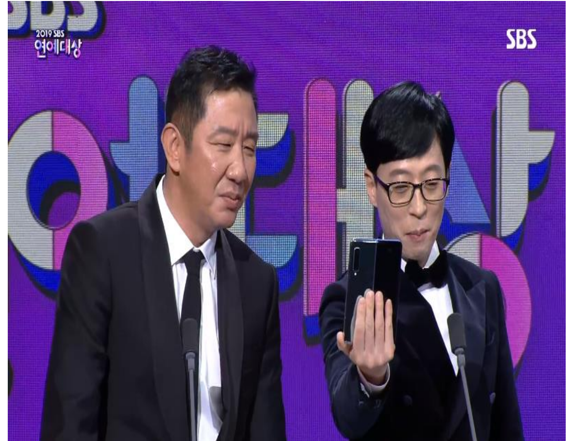
연예대상 PPL (참가기업: 삼성)