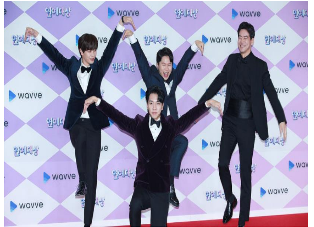
포토월 라이브 방송 생중계, 포토월 행사 (참가 기업: 웨이브)