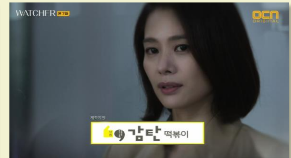
OCN 와쳐 - 감탄떡볶이