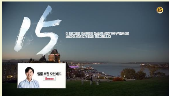
tN 도깨비 - 일룸

가상광고를 통한 브랜드 및 상품 노출 시청자 관심도가 가장 높은 시간대인 드라마 시작 또는 엔딩에 CG를 활용하여 시각적 효과가 뛰어난 영상으로 광고 노출