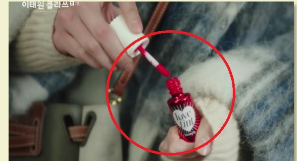
JTBC 이태원 클라쓰 - 베네피트 러브틴트