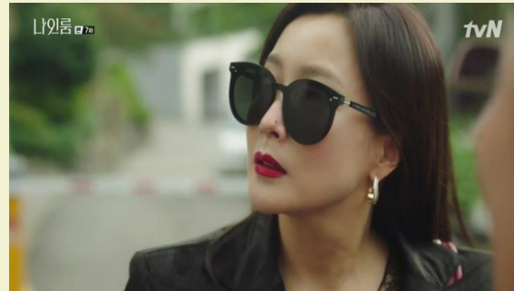
tvN 나인룸 - 젠틀몬스터