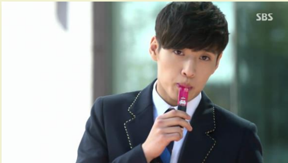
SBS 상속자들 - 정관장 홍삼스틱

주연 혹은 조연 배우가 드라마 상에서 직접 '브랜드 및 상품' 노출 (ex: 주연 배우가 매일 마시는 음료 설정)