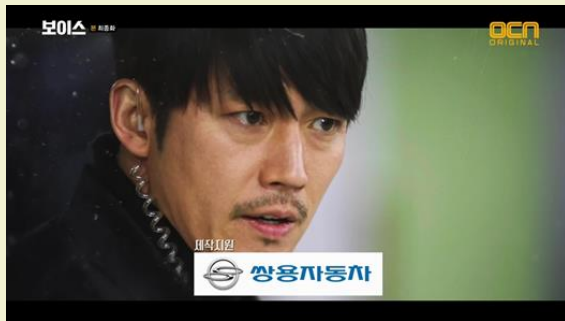
OCN 보이스 - 쌍용자동차

본방송 & 재방송 엔딩 시 제작지원 슈퍼자막 제공 몰입도가 가장 높은 엔딩에 슈퍼 자막 노출로 브랜드 이미지 상승