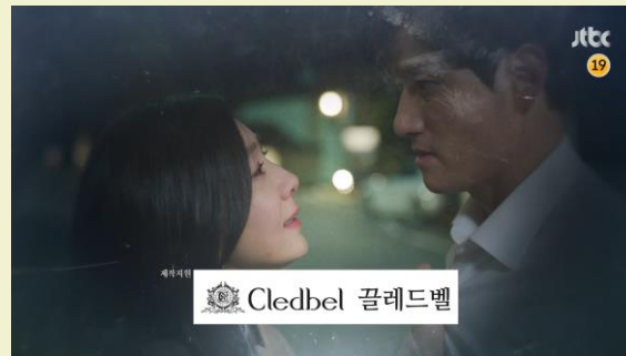
JTBC 부부의세계 - 플레드벨