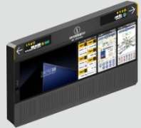
2F 2호선 대합실