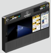
B1 2호선 승강장, 대합실