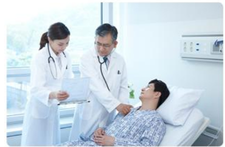
병원 / 요양원