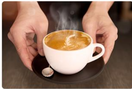
카페 / PC방