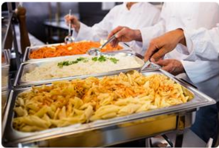
구내식당 / 함바식당