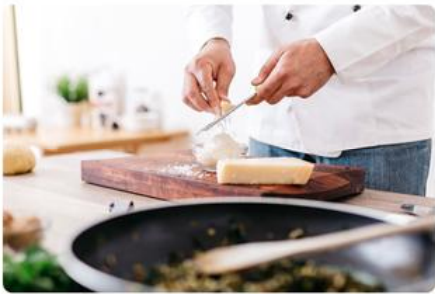
외식업 / 다중이용시설