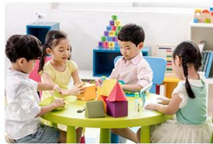
학교 / 유치원