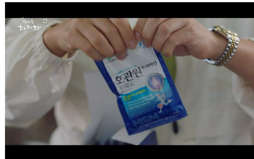
건강기능식품 식음 에피소드 tvN <갯마을차차차> - 호관원