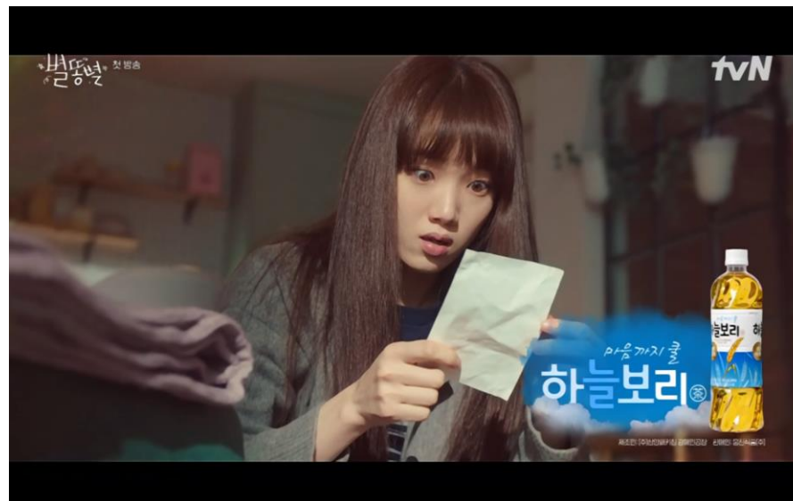
tvN <별뿔별> - 하늘보리 드라마 에필로그 / 예고편에 노출되는 가상광고

"본 제안서의 내용은 스튜디오 드래곤의 자산이며, 비공개 자료입니다. 이 자료의 전체 또는 일부를 무단으로 게시, 배포하거나 개인 용도로 활용시 법적 조치를 받을 수 있습니다."