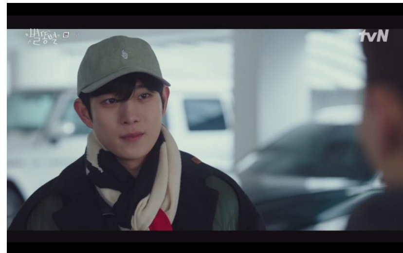
단순제품노출 tvN <별풍선> - 바이브레이트