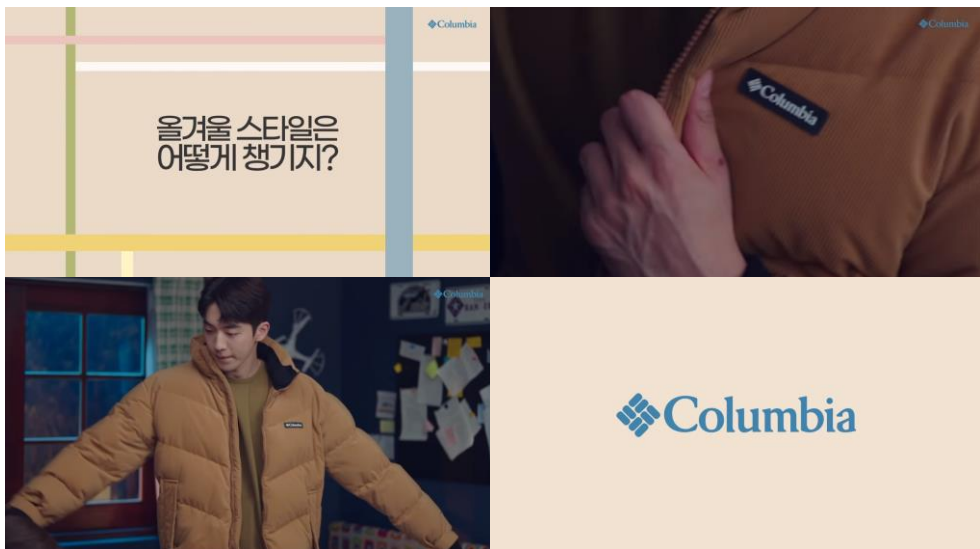
tvN <스타트업> - 컬럼비아