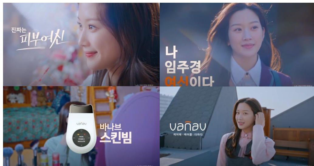
tvN <여신강림> - 바나브