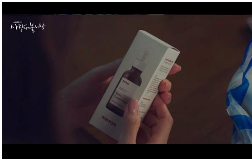
단순제품노출 tvN <사랑의 불시착> - 대녀공장

에피소드 구성 또는 대사언급 없이 드라마 내 제품 사용/착장/배치 등 단순 노출 뷰티, 식음료, 패션, 소형가전 등 생활 밀착형 제품군