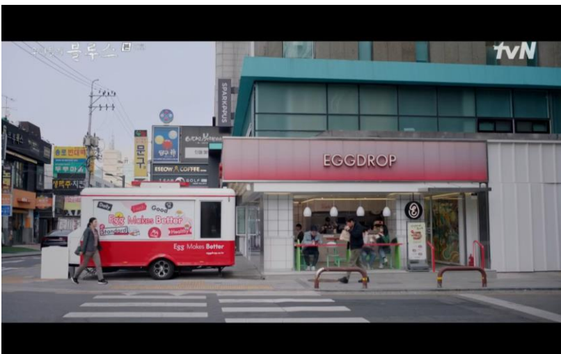
프랜차이즈 매장방문 에피소드 tvN <우리들의 블루스> - 에그드랍

드라마 내 제품 사용/대사/식음/착장 또는 매장방문 통한 브랜딩 주,조연 배우를 활용한 “에피소드” 형태로 자연스러운 브랜드 및 제품 노출