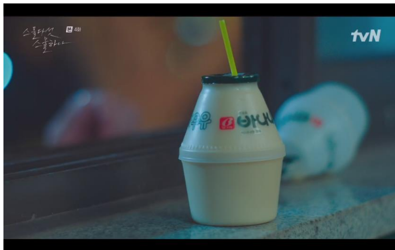
식음료군 식음 에피소드 tvN <스물다섯 스물하나> - 빙그레