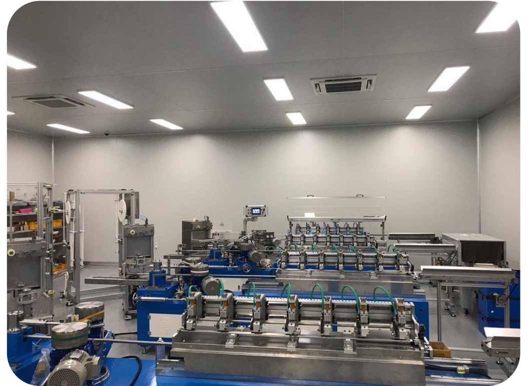
위치: 경기도 화성시