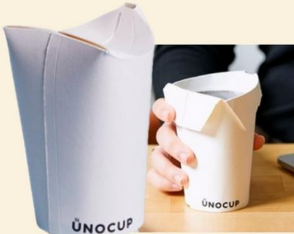
▲우노컵 참고 이미지