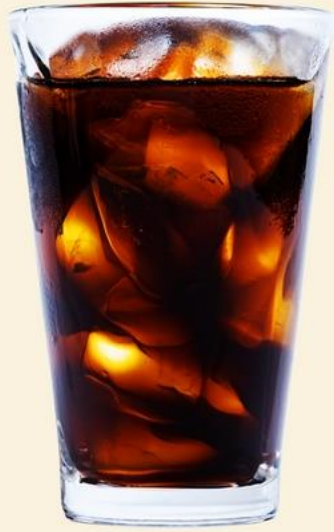
아메리카노 구매고객 (고객이 가장 많이 주문하는 메뉴)