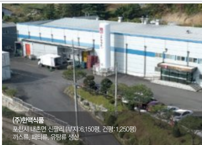
(주)한맥식품 포천시 내촌면 신말리 (부지:6,150평, 건평:1,250평) 까스류, 패티류, 유탕류 생산