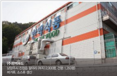
(주)한맥푸드 남양주시 진접읍 필야리 (부지:2,000평, 건평:1,350평) 버거류, 소스류 생산

(주)한맥은 1986년 사업 시작 이래 한길만 걸어온 냉동 식품전문 회사입니다.