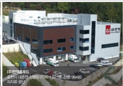
(주)한맥푸드 포천시 내촌면 신말리 (부지:1,821평, 건평:984평) 피자류 생산