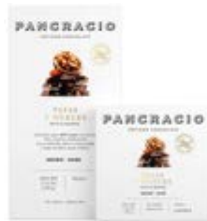
PASAS Y NUECES - CHOCOLATE NEGRO -

카카오의 섬세한 로스팅 노트와 견과도를 먹는 듯 한 달콤한 견과류가 함께, 바삭하고 달콤한 조합의 카카오 64% 다크초콜릿입니다.