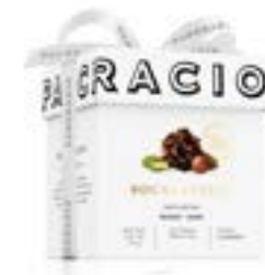
ROCAS SUIZAS - CHOCOLATE NEGRO -

캐러멜라이즈 아몬드, 헤이즐넛, 피스타치오가 함께 들어간 카카오 64% 다크초콜릿 입니다. 견과류와 카카오의 풍부한 로스팅 노트로 유니크한 맛의 조화를 이룹니다.