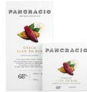
ÚNICO BEAN TO BAR - CHOCOLATE NEGRO PLANTACIÓN -

최고급 크릴로와 트리니타리오 콩에서 탄생한 혁신적이고 독특한 판크라시오만의 카카오 68% 다크초콜릿 레시피입니다. 기분 좋은 과일향과 함께 약간의 산미가 느껴지며, 입 안 가득 퍼지는 강렬한 코코아 노트가 특징입니다.