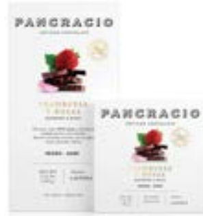
FRAMBUESA Y ROSAS - CHOCOLATE NEGRO -

최상급의 천연 라즈베리가 들어간 64% 카카오 다크초콜릿입니다. 붉은 과일의 노트와 우아한 꽃의 향기로운 정적인 아티잔 초콜릿입니다.