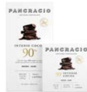
INTENSE COCOA 90% - CHOCOLATE NEGRO -

카카오 본연의 가장 진하고 강렬함의 정점인 로스팅 노트를 자랑하는 카카오 90% 다크초콜릿입니다.