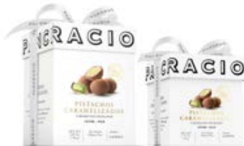
PISTACHOS CARAMELIZADOS - CHOCOLATE CON LECHE -

카카오 38%의 밀크 초콜릿으로 가볍게 덮인 캐러멜라이즈 피스타치오의 고급스러운 부드러움은 믿을 수 없을 정도로 섬세합니다.