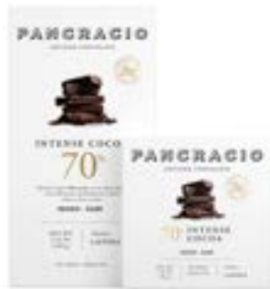
INTENSE COCOA 70% - CHOCOLATE NEGRO -

카카오의 진하고 강렬한 노트와 부드러운 터치로 균형잡힌 카카오 70% 다크초콜릿입니다.