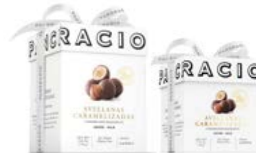
AVELLANAS CARAMELIZADAS - CHOCOLATE CON LECHE -

캐러멜라이즈 헤이즐넛을 두 겹의 화이트 초콜릿으로 덮고 카카오 38%의 밀크초콜릿 분말로 마무리한 환상적인 헤이즐넛 불.