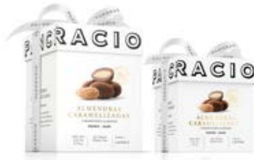
ALMENDRAS CARAMELIZADAS - CHOCOLATE NEGRO -

캐러멜라이즈 아몬드들 카카오 38%의 밀크초콜릿으로 감싸고, 카카오 64%의 다크 초콜릿 분말로 마무리한 훌륭한 터치를 느껴보세요.