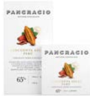
CINCUENTA SOLES PERÚ - CHOCOLATE NEGRO PLANTACIÓN -

Cincuenta Soles는 페루의 Huayabamba 강을 따라 San Martín 지역에서 선별하여 엄선된 카카오로 제작된 카카오 65% 다크초콜릿입니다. 산뜻한 과일과 붉은 과일의 터치가 균형을 이루어 완벽한 맛을 자랑합니다.