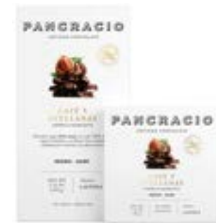
CAFÉ Y AVELLANAS - CHOCOLATE NEGRO -

콜롬비아산 100% 아라비카 커피와 헤이즐넛이 들어간 카카오 64% 다크초콜릿입니다. 바삭한 식감과 커피의 강렬함, 부드러운 크레마의 끝맛에 입 안 가득 커피를 머금은 듯 한 로스팅 노트를 자랑합니다.