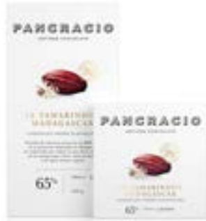
10 TAMARINDOS MADAGASCAR - CHOCOLATE NEGRO PLANTACIÓN -

마다가스카르의 마디로폴로 농장에서 유래한 카카오 65% 다크초콜릿입니다. 농장을 둘러싸고 있는 타마린드 열매가 초콜릿에 시트러스 터치와 우드랑, 약간의 감초향을 더해줍니다.