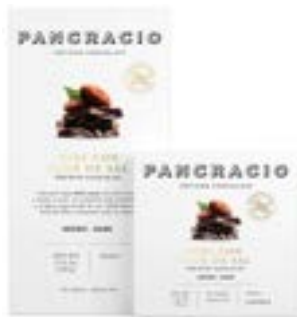
NIBS CON FLOR DE SAL - CHOCOLATE NEGRO -

카카오와 견과류의 로스팅 노트가 뛰어난 카카오 64% 다크초콜릿입니다. 바삭하게 구워 캐러멜화 된 카카오 님스와 에브로 델타 강의 100% 천연 꽃 소금의 가벼운 터치가 모든 뉘앙스를 조화롭게 만듭니다.