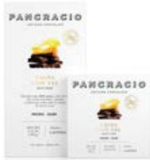
CHIPS CON SAL - CHOCOLATE NEGRO -

솔티 칩이 들어간 카카오 64% 다크초콜릿입니다. 바삭하며 달콤 짭짤한 참신한 레시피로, 우리 카카오의 모든 뉘앙스를 더욱 부각시켜 한 단계 높은 맛을 자랑합니다.