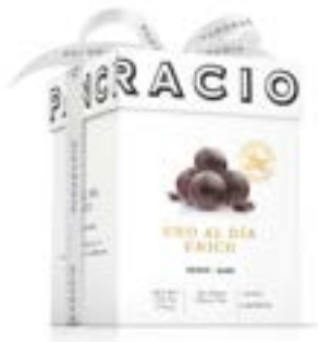
UNO AL DÍA, ÚNICO - CHOCOLATE NEGRO -