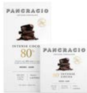
INTENSE COCOA 80% - CHOCOLATE NEGRO -

카카오 본연의 맛을 살린 로스팅 노트로 더욱 풍부한 맛을 선사하는 카카오 80% 다크초콜릿입니다.