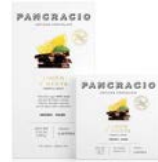
LIMÓN Y MENTA - CHOCOLATE NEGRO -

레몬과 민트가 들어간 카카오 64% 다크초콜릿입니다. 레몬의 가벼운 산미와 민트의 기분좋은 상쾌함으로 끝없는 즐거움을 주는 아티잔 초콜릿입니다.