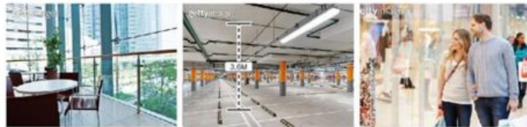
이전 사진은 단지 및 도로는, 3차산업시설 등 1차, 2차, 3차 산업 단지 내 시설입니다.