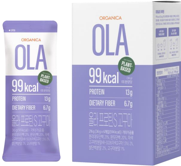
All Green, Plant – Based Protein