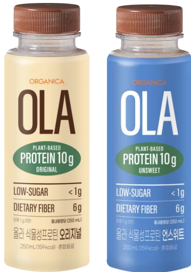
All Green, Plant – Based Protein