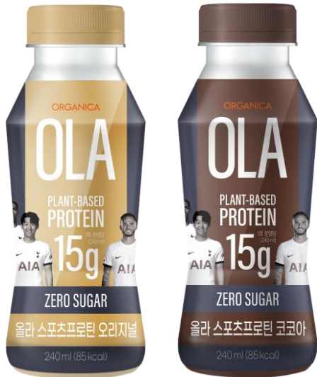
All Green, Plant – Based Protein