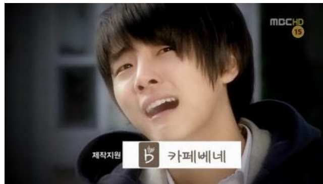
MBC '지붕 뚫고 하이킥'의 한 장면

카페베네는 2008년부터 대한민국 토종 커피 브랜드로서 커피 외에도 배려 및 진정성 등 카페 그 이상의 가치를 소비자에게 전달해오고 있습니다.