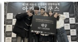
▲ 대외활동과 공모전 참여