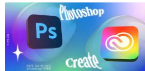
▲ 영상 / 디자인 토폴 교육