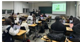
▲ 정규 세미나