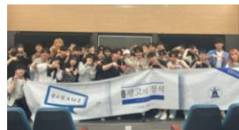
▲ 실무자 초청 강연