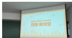
▲ ALUMNI 특강