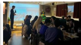
▲ NEOAD 영상제 '네오의 밤'