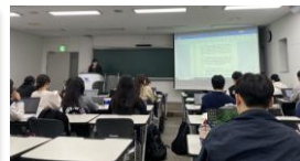
▲ ST 스튜디오