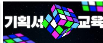
▲ 광고 기획서 정기 세미나