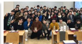
▲ ICON의 밤