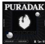
▲ 산학협력 경쟁 PT