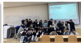
▲ 포토샵 교육 세미나