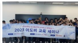
▲ 기업 견학 및 교육 세미나