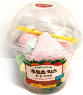
<세븐일레븐 - 샐러드 젤리>