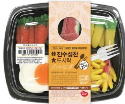
<CU - 도시락 젤리>