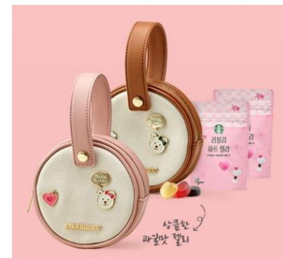
<스타벅스 - 2022 화이트데이>