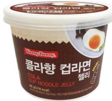
<CU - 컵라면 젤리>