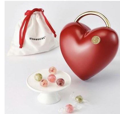
<스타벅스 - 2020 화이트데이>