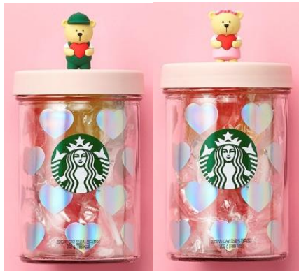
<스타벅스 - 2019 화이트데이>

■ 고객사에서 원하는 다양한 Package 기획 가능 - <유통거래처 기획 상품>