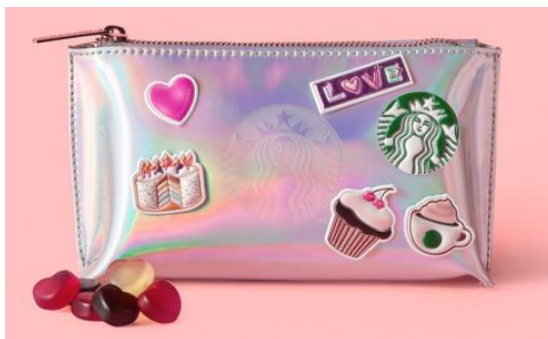
<스타벅스 - 2021 화이트데이>